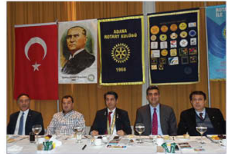
Dönemimizin ikinci asamblesini gerçekleştirdik

Bende bu vakaatın ilk hissi teşebbüsü, bu memlekette, bu güzel Adana'da doğmuştur.