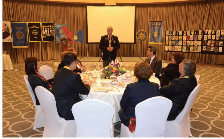
"Governörümüz Konuşmasını yaparken"