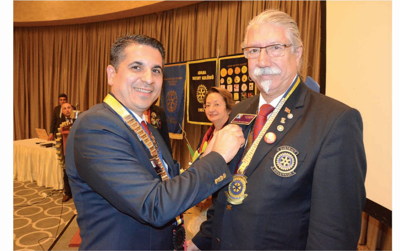
Governörümüz Gürkan Olguntürk'le Başkanımız Kulübümüzün 45.yaş rozetini takdim ederken

Birçok güçlükler ve engeller karşısında bulunduğumuzu biliyoruz. Bunların hepsini inceleme ile, gayret ve iman ile ve millet aşkının sarsılmaz kuvvetiyle birer birer çözüp sonuçlandıracağız.