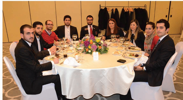
"Rotaract Kulübümüz başkanı ve üyeleri de toplantımızda misafirimizdi."