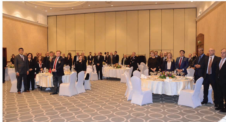
"Üyelerimiz yemin töreni sırasında toplu halde"