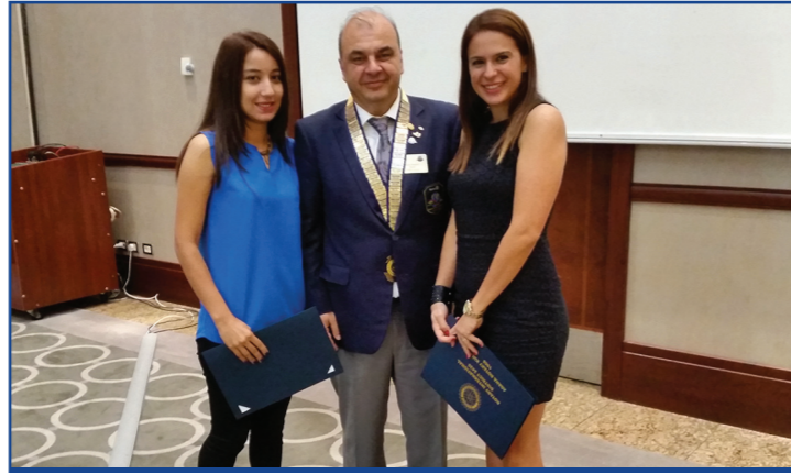
Konuşmacılarımız bizlere beslenme ile ilgili yararlı bilgiler verdi.