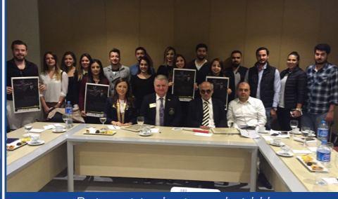
Rotaract toplantısına katıldık