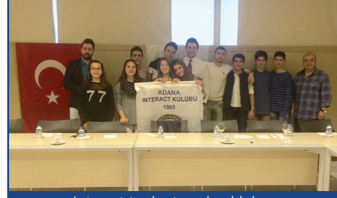
Interact toplantısından bir kare