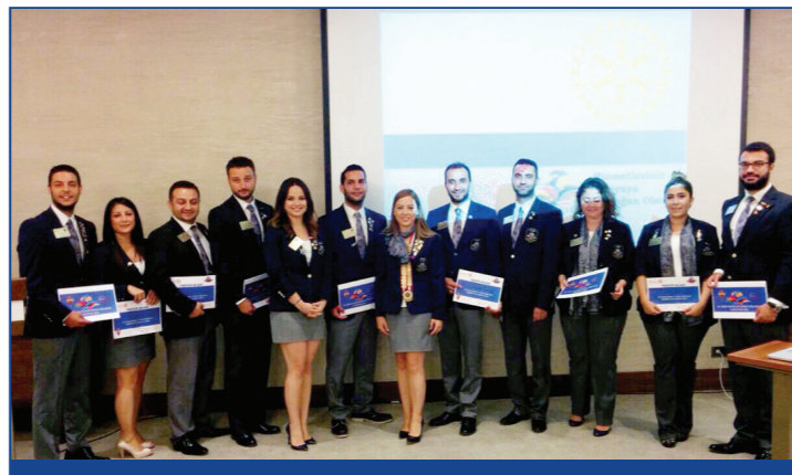
10. Gruplar 1. Ortak toplantıda 2430. Bölge Rotaract temsilcimize ve Bölge görevlilerimize teşekkür sertifikalarını dağıttık.