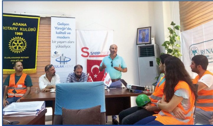
İş barışı, iş güvenliği seminerinden bir kare.