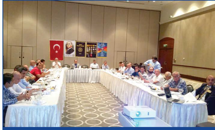
Toplantımızda katılım oranımız yüksekti.