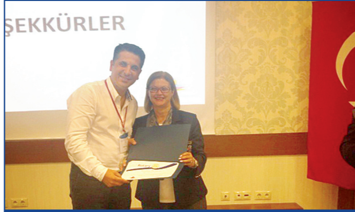
Governör Yrd. Tolga Tutaş, seminerde sertifikasını alırken.