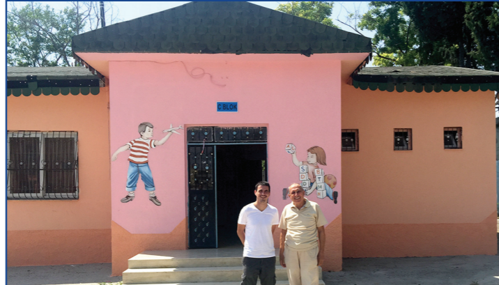
İmadettin Levent İlköğretim Okulu'nun yeni hali.