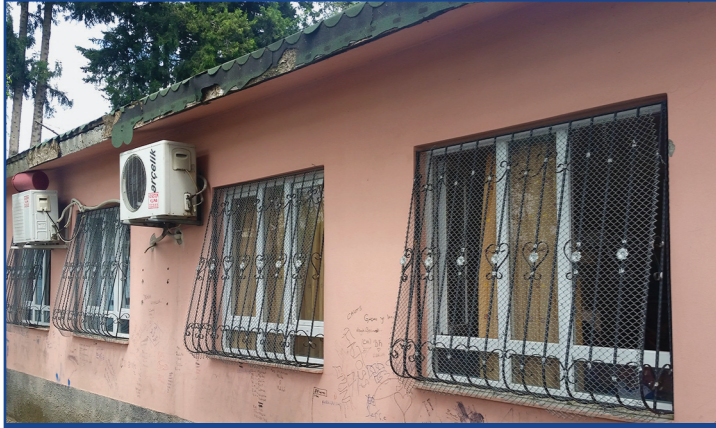
İmadettin Levent İlköğretim Okulu'nun eski hali.