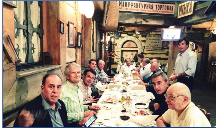
Kiev gezisi yemeğinden görüntü