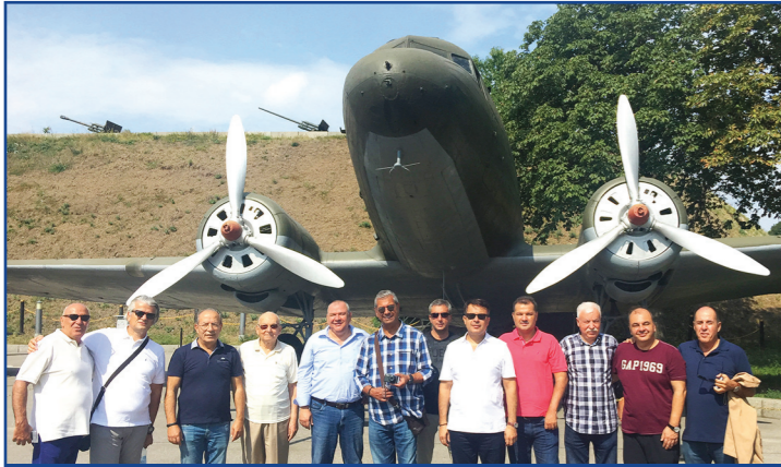
Kiev'de bulunan II. Dünya Savaşı Müzesi'nden görüntü