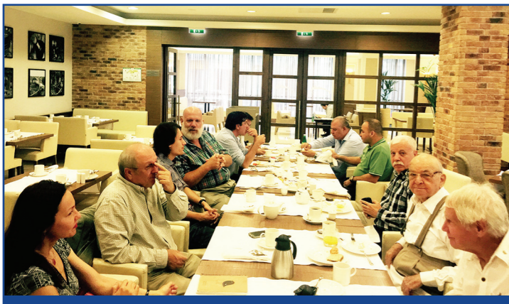
Kardeş kulübümüzle toplantıdan kare