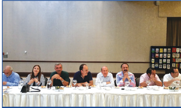
Değerli Üyelerimiz ve Tarsus RK. Üyeleri birlikte