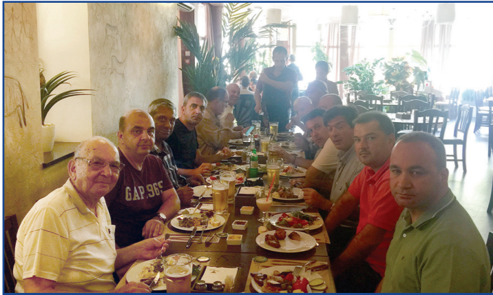
Kiev gezisi yemeğinden görüntü