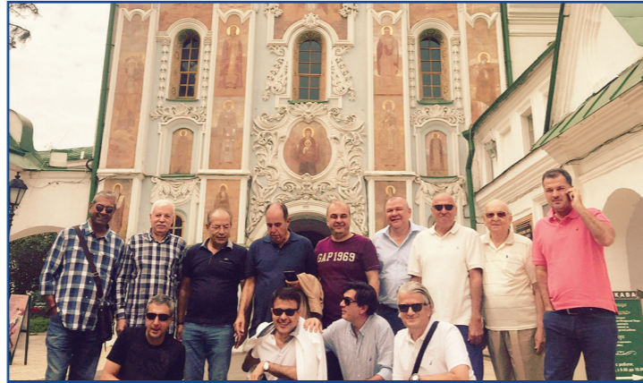
Trinity Gate Kilisesi (Pechersk Lavra)'nden görüntü