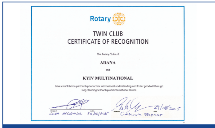
Kardeş kulüp sertifikamız.